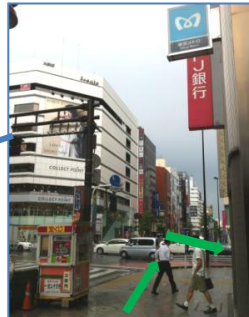
【新宿三丁目駅 A1～3出口から】 伊勢丹を目の前にして右方向へ。その後UFJ銀行をすぐ右に曲がって下さい。